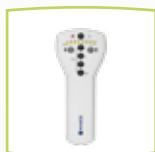
Aparato de mano MA 1